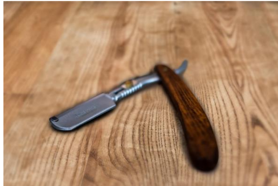
Navaja profesional con mango imitación madera y lomo de metal plata, para colocar hoja de afeitar.