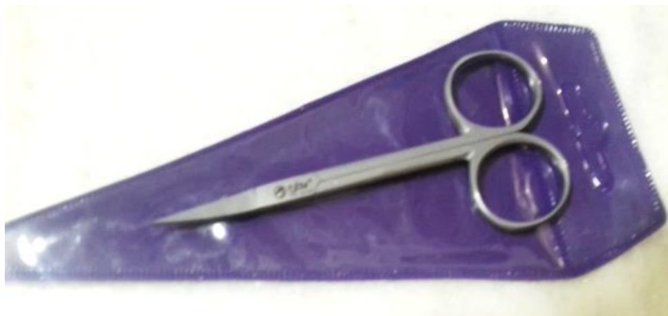
Tijera para manicure punta curveada 4"