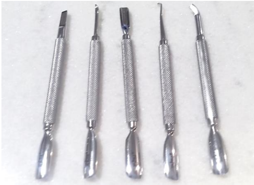
Kit de 5 empujadores