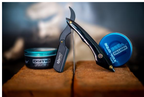
Navaja profesional con mango en marfil de búfalo y lomo de metal en color negro, para colocar hoja de afeitar.