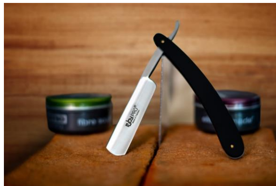
Navaja profesional con mango en material de plástico resistente color negro y lomo de metal color blanco, estilo tradicional con hoja de afeitado incorporada. Afilado con corte preciso.