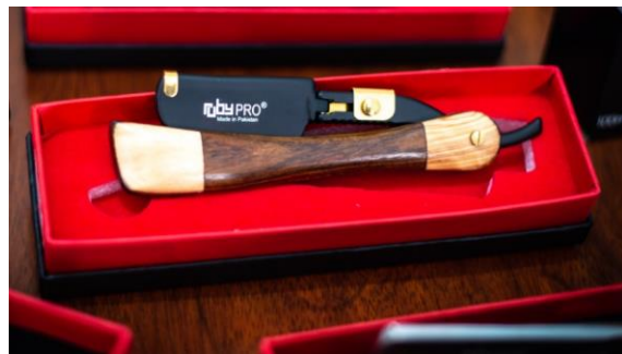
Navaja profesional con mango con acabado imitación madera y lomo de metal en color negro, para colocar hoja de afeitar.