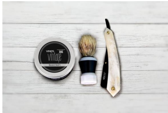
Navaja profesional con mango en marfil de camello y lomo de metal color negro, para colocar hoja de afeitar.