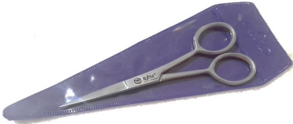
Tijera para manicure punta plana 4.5"